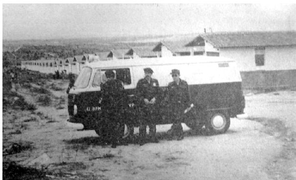
Imagem 02: Policiamento em uma das saídas do Conjunto Álvaro Gaudêncio.

2. O conjunto continha 3.300 casas abandonadas, dispostas em uma área de 18 mil metros quadrados divididos em cinco conjuntos, Bodocongó I, II, III, IV e V; essas residências foram ocupadas por sem-tetos provenientes dos bairros de Santa Rosa, Bodocongó, Centenário, José Pinheiro, Pedregal e Cruzeiro. (MIGUEL; SILVA, 2007).